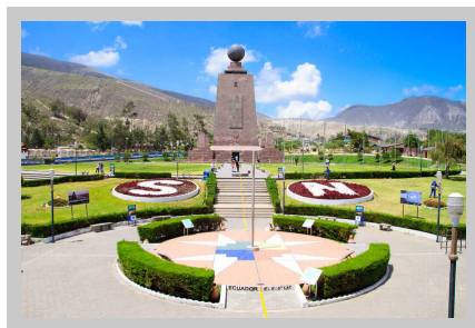
Monumento a La Mitad del Mundo